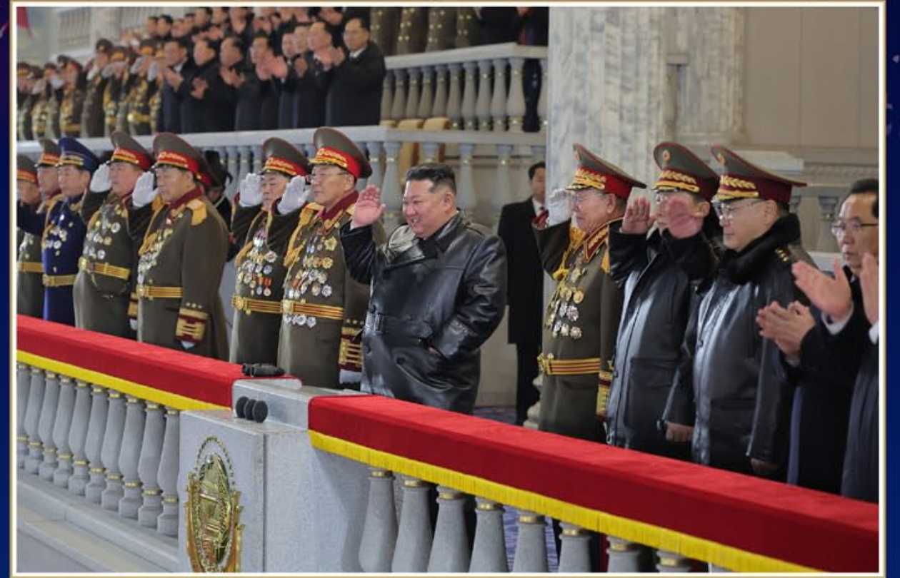
El Secretario General envió un cordial saludo combativo a estas unidades selectas que realizaron las indelebles proezas que se registrarán para siempre en los anales de la patria demostrando al mundo la superioridad ideo-política y potencia típicas del EPC que considera como su vida la fidelidad absoluta al PTC.