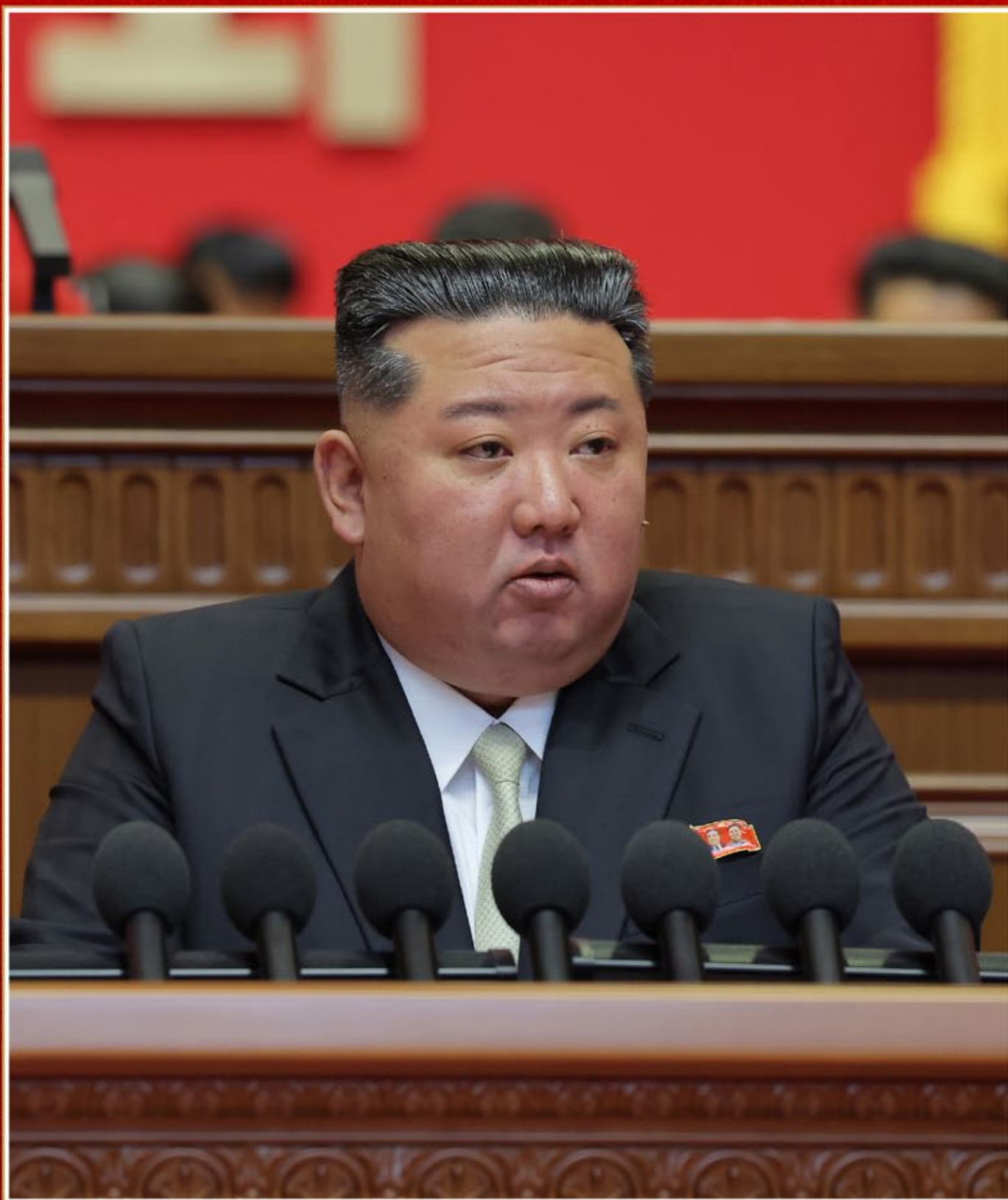
El estimado camarada Kim Jong Un pronunció el discurso de clausura en el IX Congreso del Partido del Trabajo de Corea.