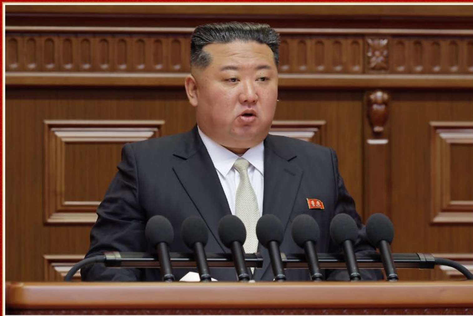
El camarada Kim Jong Un rindió el informe sobre las labores del VIII Período del CC del PTC.

El informe se compone por el siguiente orden: