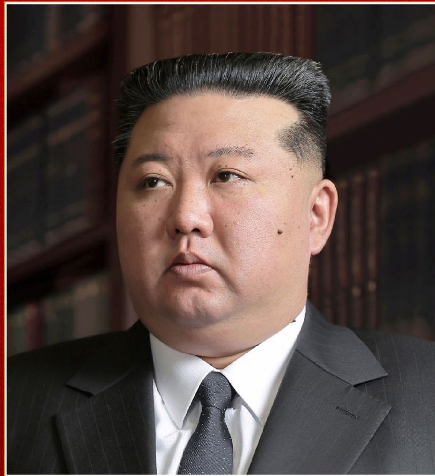
Estimado camarada Kim Jong Un, Secretario General del Partido del Trabajo de Corea

Todos los delegados del IX Congreso del PTC aprobaron unánimemente la resolución de elegir al camarada Kim Jong Un como Secretario General del PTC reflejando la voluntad y deseo unánimes de los militantes de todo el Partido.