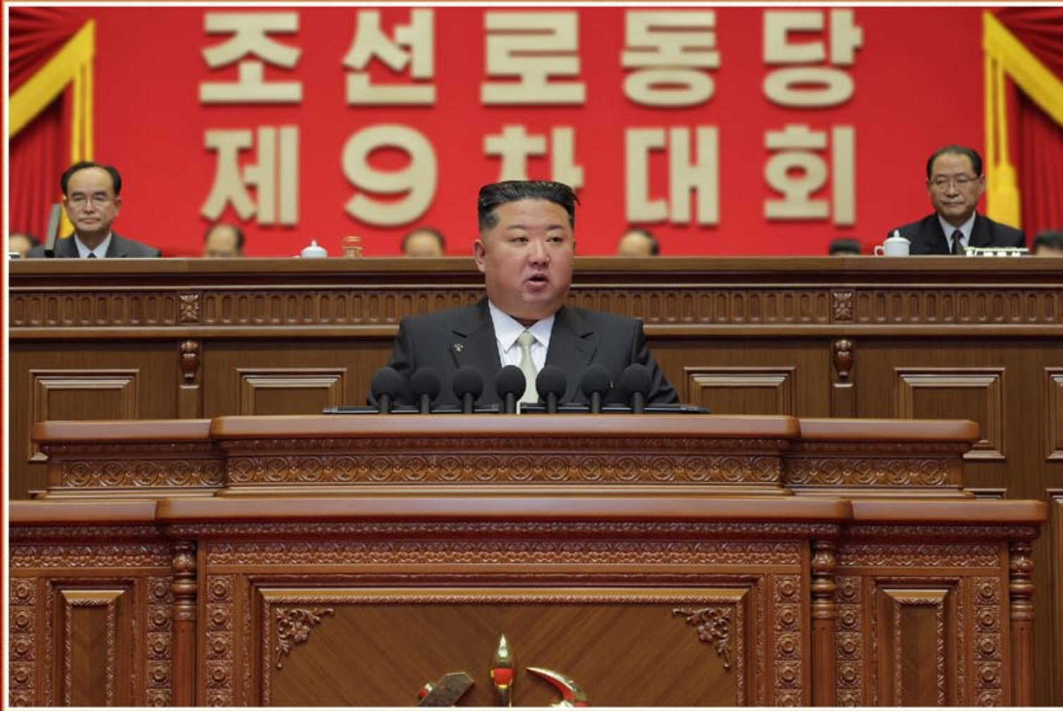
El estimado camarada Kim Jong Un pronunció el discurso de apertura del IX Congreso del PTC.

El último lustro que siguió al VIII congreso fue un periodo orgulloso en que todo el Partido y el pueblo, unidos compactamente, abrieron una coyuntura trascendental para el cumplimiento de la causa del socialismo a nuestro estilo, dijo y afirmó que un lustro atrás, convocamos el octavo congreso con la fe, voluntad y disposición de abrir a todo trance una nueva era de avance y desarrollo, superando con nuestros propios recursos la crítica situación que atravesaba la revolución y que hoy estamos de cara al noveno congreso llenos de optimismo y confianza en el futuro. Este es, ciertamente, un enorme cambio y desarrollo y un logro enorgullecedor en la etapa actual, aseveró.